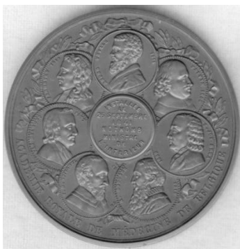
Рисунок 2. Медаль с портретом Аверс ван Гельмонта. Бельгия. Реверс