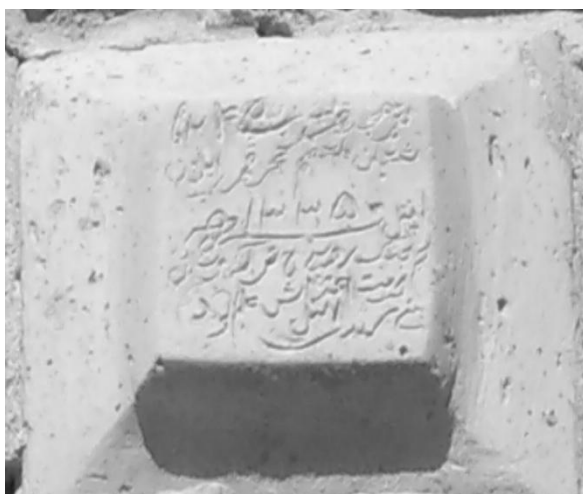
Рисунок 3. Надписи на мечети «Мейдан»

Об ошибках в чтении и переводе надписи говорилось выше; 2) не дает информацию о размере надписи под номером 1274, фото, графическое изображение, о типе материала; наряду с этим, не говорит о других надписях; обходит молчанием над фактом дачи информации об этих надписях В.М. Сысовым. Не соблюдена хронологическая последовательность в подаче надписи; 3) Надпись над окном внутри