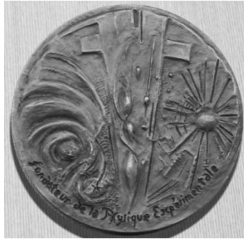
Рисунок 6. Медаль, посвященная Эдму Мариотту. Франция. Реверс

Водная теория питания растений помогла сделать вывод о питании растения, как процессе его жизнедеятельности, а не простом всасывании питательных веществ из почвы.