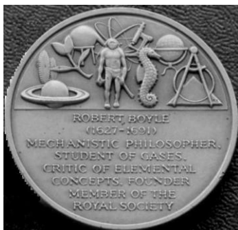
Рисунок 4. Медаль, посвященная Роберту Бойлю. США. Реверс

Французский физик, аббат Эдм Мариотт (фр. Edme Mariotte , 1620—1684) считал, что питательные вещества образуются самими растениями в результате протекающих в них химических процессов, аргументируя свое предположение примером произрастания на одном участке разных растений, продуцирующих различные вещества, отсутствующие в почве. Мариотт впервые исследовал процесс транспирации, определив количество выделенной растением влаги.