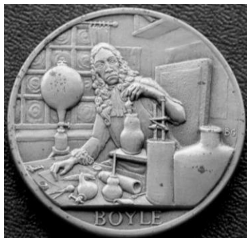
Рисунок 3. Медаль, посвященная Роберту Бойлю. США. Аверс

Бойлю посвящена американская настольная медаль (38 мм, бронза, 1972). На аверсе — Бойль, сидящий в лаборатории в окружении химического оборудования (рис. 3). Под изображением — надпись: «BOYLE» (БОЙЛЬ). В верхней части реверса (рис. 4) — изображения первобытного человека, планеты Юпитер, морского конька, реторты и т.д. Под изображением — надпись в восемь строк: «ROBERT BOYLE / (1627—1691) / MECHANISTIC PHILOSOPHER, / STUDENT OF GASES, / CRITIC OF ELEMENTAL / CONCEPTS. FOUNDER / MEMBER OF THE / ROYAL SOCIETY» (РОБЕРТ БОЙЛЬ (1627—1691) ФИЛОСОФ-МЕХАНИСТ, ИССЛЕДОВАТЕЛЬ ГАЗОВ, КРИТИК КОНЦЕПЦИИ ЭЛЕМЕНТОВ, ЧЛЕН-ОСНОВАТЕЛЬ КОРОЛЕВСКОГО ОБЩЕСТВА).