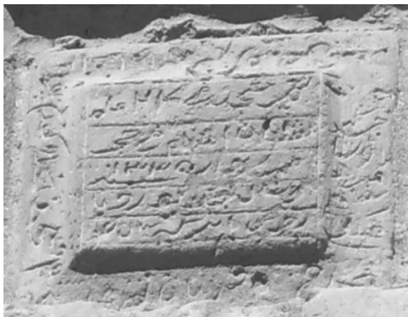
Рисунок 2. Надписи на мечети «Мейдан»