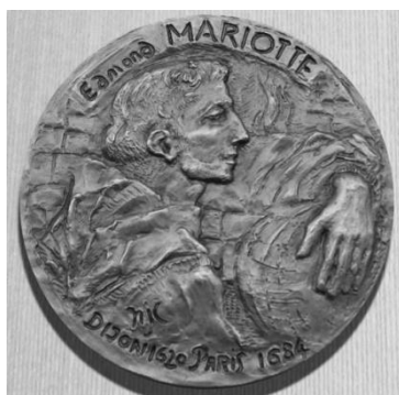
Рисунок 5. Медаль, посвященная Эдму Мариотту. Франция. Аверс

Портрет Мариотта — на аверсе (рис. 5) французской медали (73 мм, бронза). По краю — надписи: «EDMOND MARIOTTE» и: «DIJON 1620 PARIS 1684». Реверс (рис. 10) — композиция, в правой части которой угадывается Солнце. По краю, внизу надпись: «FONDATEUR DE LA PHYSIQUE EXPERIMENTALE» (ОСНОВАТЕЛЬ ЭКСПЕРИМЕНТАЛЬНОЙ ФИЗИКИ).