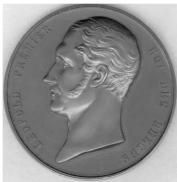
Рисунок 1. Медаль с портретом ван Гельмонта. Бельгия

Портрет ван Гельмонта присутствует на бельгийской медали (57 мм, бронза), посвященной организации Королевской академии медицины Бельгии. На аверсе медали — портрет бельгийского короля Леопольда I (рис. 1). На реверсе (рис. 2), в окружении портретов семи выдающихся бельгийских ученых, врачей (среди которых третий сверху слева — ван Гельмонт) — надпись: «INSTALLÉE LE 26 SEPTEMBRE 1841 NOTHOMB MINISTRE DE L'INTÉRIEUR» (УЧРЕЖДЕНА 26 СЕНТЯБРЯ 1841 МИНИСТРОМ ВНУТРЕННИХ ДЕЛ НОТОМБОМ). По краю медали, снизу надпись: «ACADEMIE ROYALE DE MEDECINE DE BELGIQUE» (КОРОЛЕВСКАЯ АКАДЕМИЯ МЕДИЦИНЫ БЕЛЬГИИ).