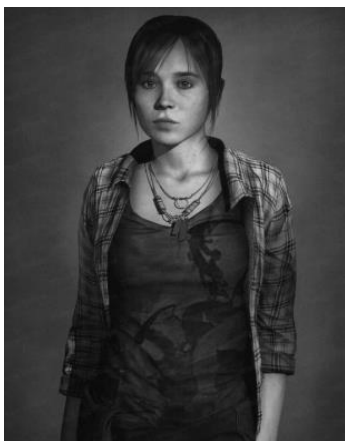
Рисунок 2. Кадр из игры

На приведенных выше примерах, фотографиях, мы можем видеть максимальное сходство компьютерной модели и реального человека. Добиваясь такого сходства, помимо упомянутых нами выше эффектов, разработчики преследовали следующие цели: