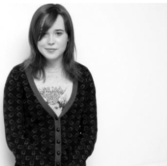
Рисунок 1. Фотография актрисы