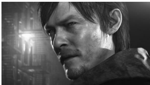
Рисунок 2. Кадр из новой игры