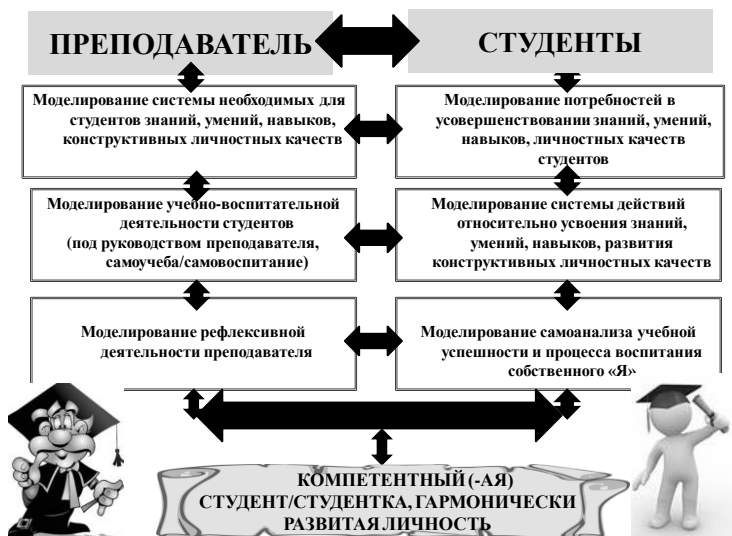
Рисунок 1. Модель взаимодействия преподавателя и студентов

раздаточного материала, оценочных карточек с положительными аффирмациями, карточек успешности студента (фиксация набранных баллов за посещение лекций, устные ответы, дополнения, письменные работы на практических занятиях, модульные контрольные работы, самостоятельная работа дома); интерактивность методов и форм обучения, воспитания на лекционных и практических занятиях; приведение интересных фактов с педагогики обучения, воспитания; установление взаимосвязи с жизнью и т. п.