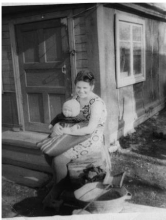
Рисунок 2. «Фотография Громыко А.Ю (1962 г.)»