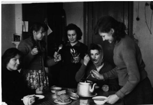
Рисунок 3. Фото женщин за обедом (1960 г.)