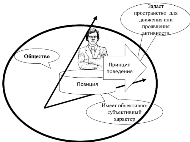
Рисунок 1. Понимание «позиции» в социуме

Анализируя результаты аналитических размышлений представленных авторов, позицию человека можно представить в виде направленного вектора движения (рис. 1):