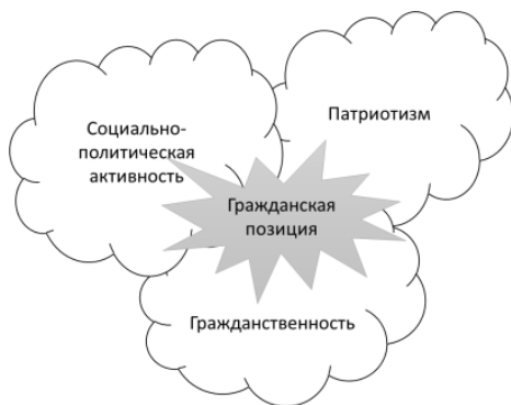
Рисунок 2. Компоненты, входящие в состав понятия «гражданская позиция»

Вместе с тем, большинство ученых выделяют три основные составляющие, входящие в состав понятия «гражданская позиция»: патриотизм, гражданственность и социально-политическая активность (Рис. 2).